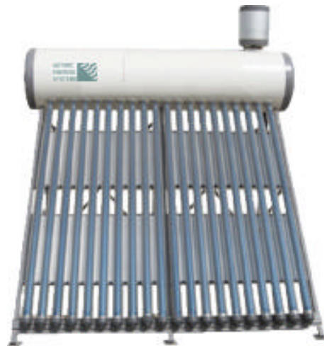
Bildbeispiel Modell Variante TZ47/1500/20_200 mit 20 Röhren ( 2,5 m 2 ) und 200 Liter WW-Boiler