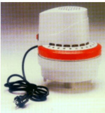
Motor / Filtereinheit als Nachrüstsatz für Aschebehälter